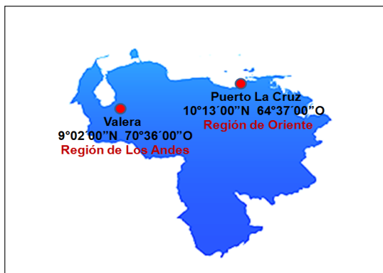
Figura 1: Ubicación espacial de las ciudades seleccionadas para la investigación.

condiciones climáticas son de temperaturas altas durante todo el año, con valores promedios de 29°C. Las precipitaciones son bajas, menores a los 600 mm al año, con un período húmedo que abarca de 2 a 5 meses, lo cual determina condiciones de semiaridez pronunciada que frecuentemente dificulta obtener una cosecha segura de cultivo de ciclo corto al año. Sin embargo, su costa se encuentra ubicada en la franja marino-costera con la mayor riqueza ictiológica del país debido a la presencia de aguas con temperaturas promedio de 15°C, baja salinidad, alto contenido de oxígeno y alta penetración de luz, creándose condiciones muy favorables para el desarrollo de varias especies. Es un gran puerto pesquero, donde se desarrolla particularmente una muy activa pesca artesanal; sin embargo, su estratégica ubicación lo ha convertido en un importante puerto de exportación petrolera, principal actividad económica de Anzoátegui. (Elizalde et al., 2007; Cilento, 2007).